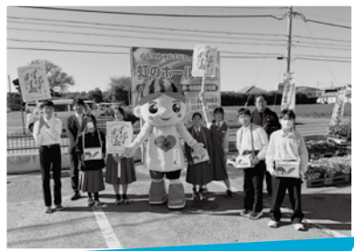
JA富里市産直センター1号店での街頭募金活動