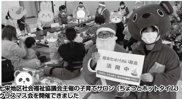
七栄地区社会福祉協議会主催の子育てサロン(ちよっとホットタイム)でクリスマス会を開催できました

①地域ふれあい事業：市内の社会福祉施設・地区社会福祉協議会・ボランティアグループが年末年始に実施する地域住民やボランティアとの交流会を目的とした独自の事業に対し、助成金として配分させていただきました。