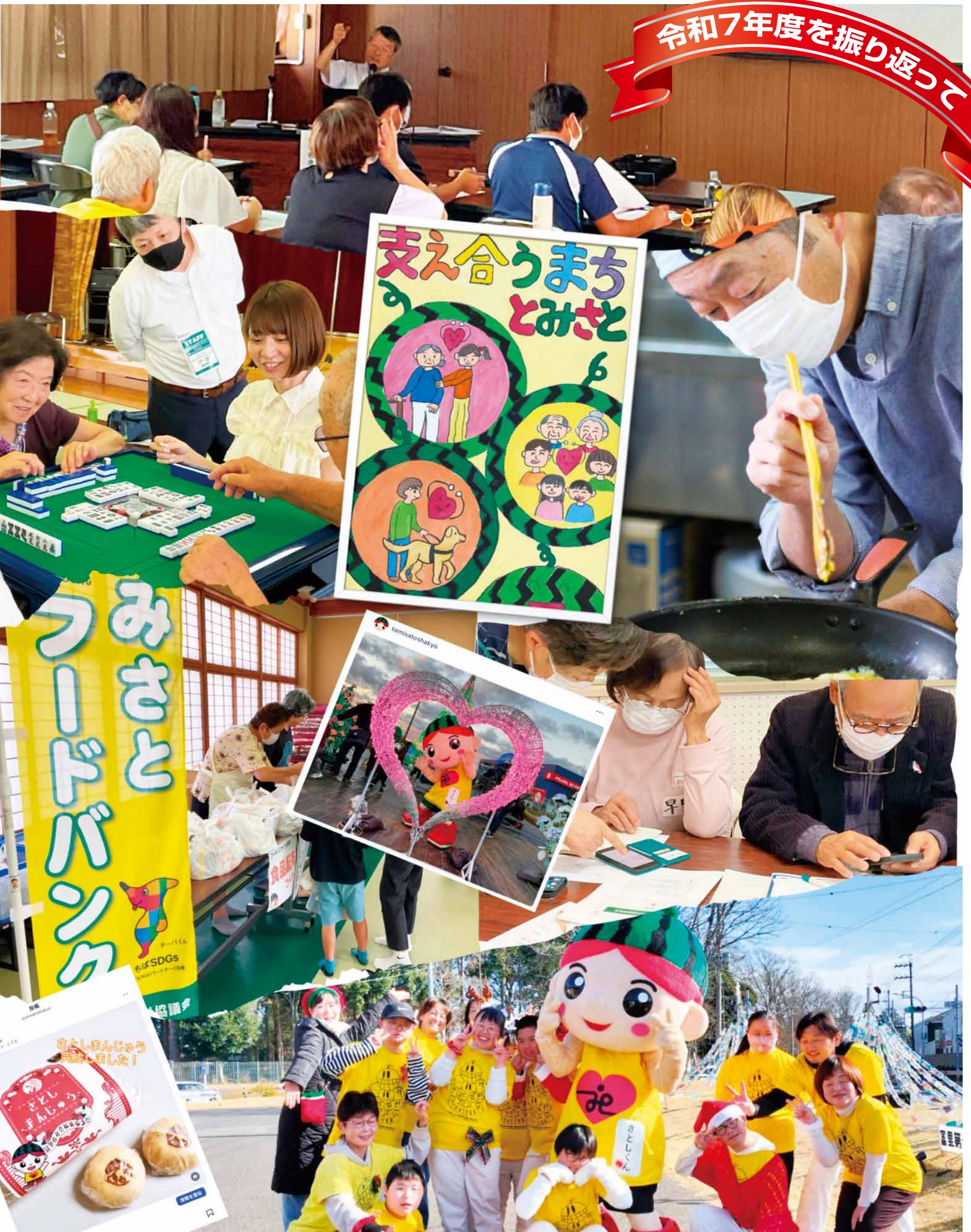
※写真説明は、2ページにあります。

〔編集・発行〕 社会福祉法人 富里市社会福祉協議会 〒286-0221 富里市七栄653-2 福祉センター内 TEL 0476 (92) 2451 FAX 0476 (92) 2495 www.tomisatoshakyo.or.jp