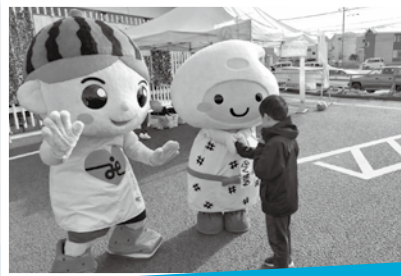
白井市支会との2回目となる合同街頭募金活動を実施しました